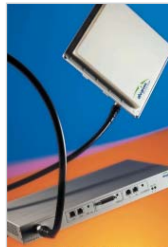
WALKair 3000 för trådlöst bredband.