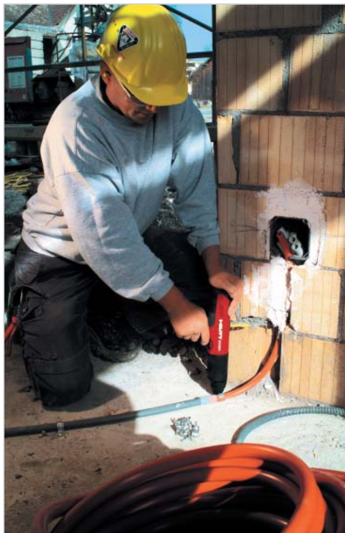
Hilti DX 351 El & VVS är ett verktyg för lätta till medeltunga montage och är speciellt lämpad för trånga, oåtkomliga ställen.