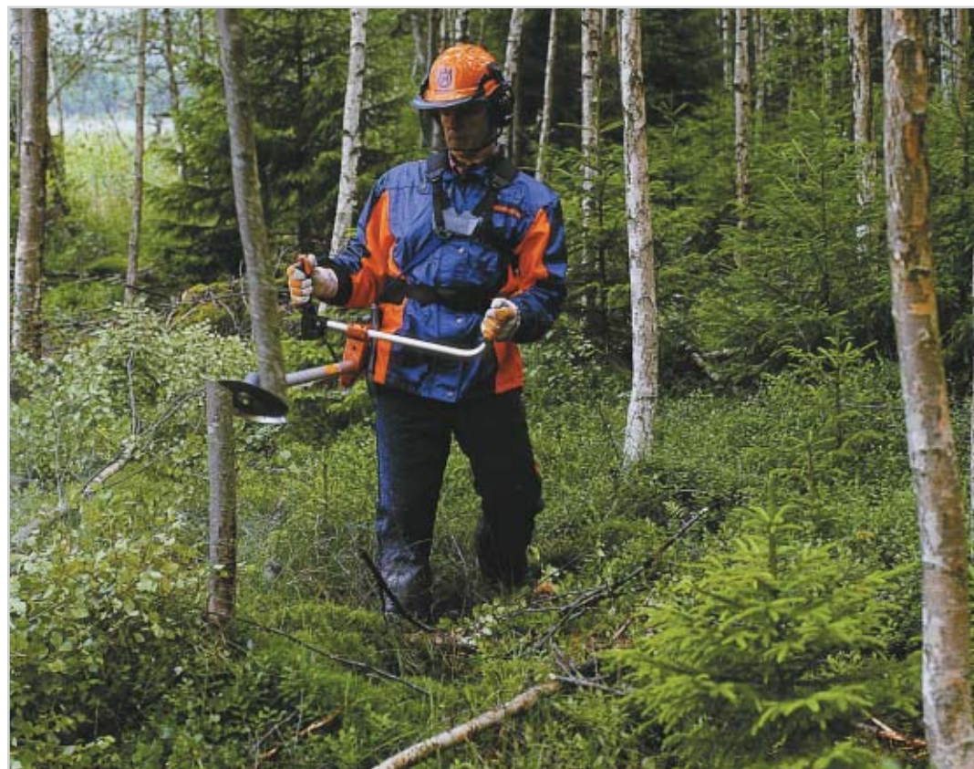
Husqvarna 240F är kort och kompakt och motormässigt en av de minsta skogsröjarna i Husqvarnas sortiment.