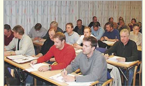
Artikelförfattaren i främre raden med röd tröja. Bilden tagen vid ett välbesökt (?) LR i Göteborg.

Vad är facket? Det är du, dina arbetskamrater och eran vilja. Sen finns det verktyg för att underlätta arbetet med att få sin vilja igenom. LR är ett av dem. LR är en samling elektriker från hela Västsverige som är valda av sina kompisar på klubben att tycka som dom i frågor som rör vad facket ska pyssla med. Det för att du ska få en så bra service av facket som möjligt. LR träffas numera två gånger om året. Där formas det arbete som avdelningen ska arbeta med under året. En av träffarna sitter man i grupper och arbetar fram förslag till hur facket kan bli bättre och effektivare. Sen finns det andra nödvändiga uppgifter också, som att välja representanter till olika styrelser. Behandla motioner (förslag till förändringar) från medlemmar är en annan uppgift.