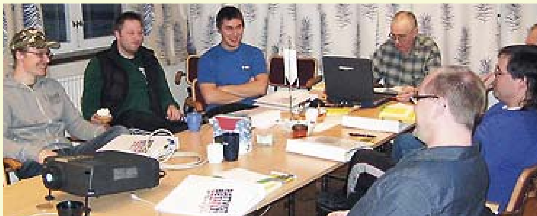
Glada miner vid en av 21:ans ATL-utbildningar.