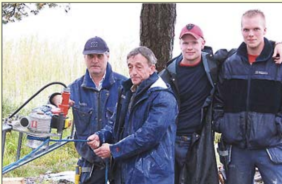
Montörer på Bergendahls i en något ovanlig situation. Kabeldragning vid en sjö...