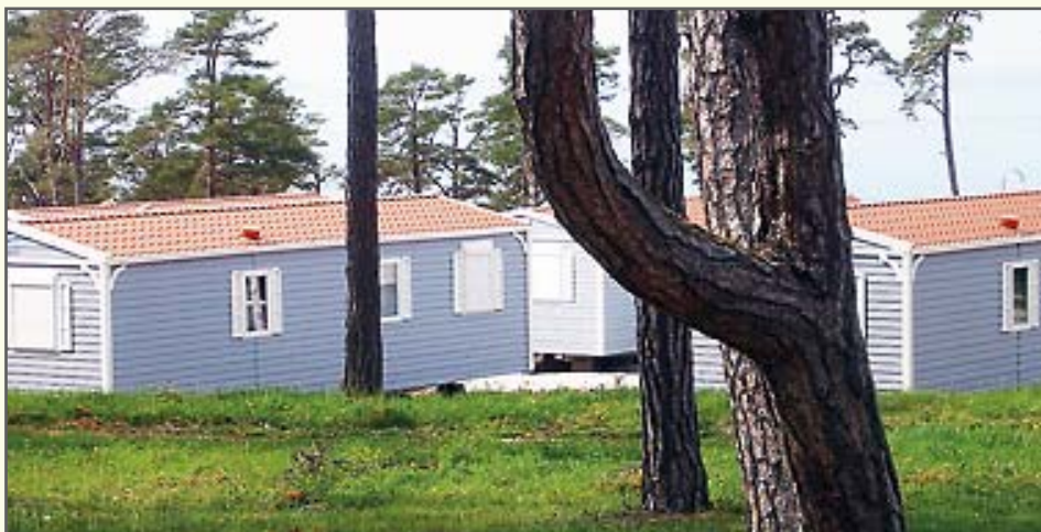
Villavagnar på Gotland med hänförande utsikt över vattnet.

Ordförande, avd 1. kjell.drotz.1@sef.com