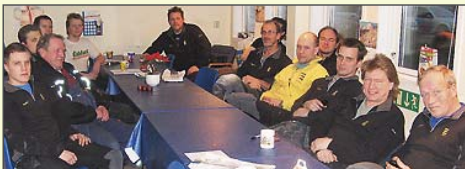
Montörer på Inter EL i Kungälv samlade för kombinerat UVA/Klubbmöte.