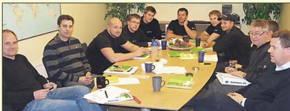
Montörerna på Johanssons EL i Skara, precis som på Bergendahls i Göteborg, är samlade inför gemensam utbildning i ATL.